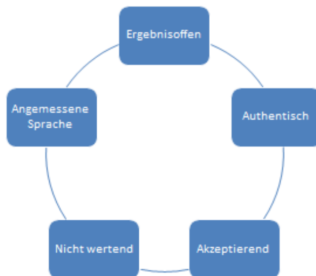
Abbildung 1: Merkmale empathischer Beratung

Menschen, die in der Beratung zu STI tätig sind, müssen die Grundlagen gelingender Kommunikation kennen und anwenden können - nicht zuletzt, weil Themen wie Sexualität mit Tabus besetzt sind. Eine theoretische Grundlage für die Beratung bietet insbesondere das Konzept der Family Health International (2004) für die HIV-Testberatung VCT Toolkit 3 . Danach ermöglicht eine non-direktive Gesprächsführung mit offenen Fragen und verstärkenden Antworten, die Raum für Reflexion und Entwicklung lässt, Verhaltensänderungen über eine Aneignung neuen Wissens hinaus.