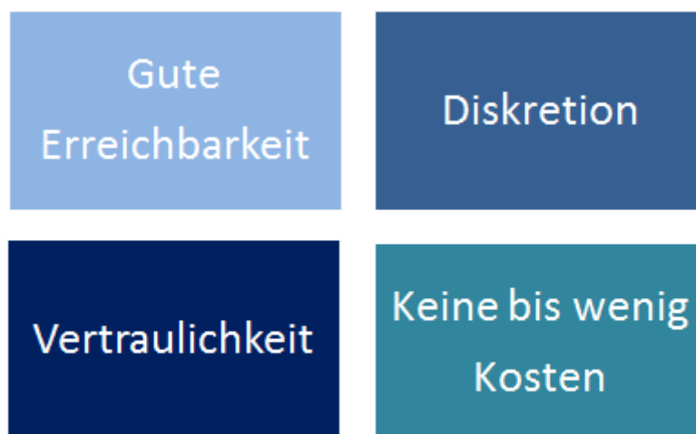
Abbildung 2: Zugangs- und Rahmenbedingungen für eine Beratung

Beratungsangebote werden eher angenommen, wenn sie niedrigschwellig und lohnend für die Ratsuchenden oder eines Rates Bedürftigen sind. Das Beratungsangebot soll so beworben werden, dass es der Zielgruppe entspricht.