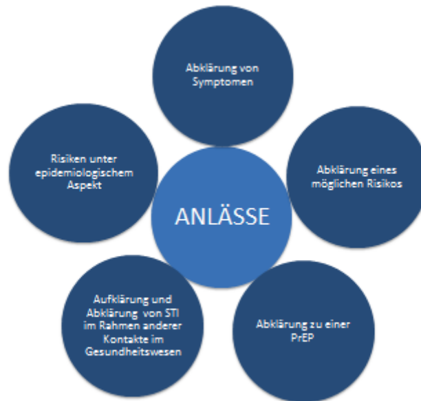
Abbildung 4: Anlässe für Beratung

Beratung im Zusammenhang mit STI erfolgt aus unterschiedlichen Anlässen. Unabhängig vom Anlass sind die in Abschnitt 2.1 und 2.2 dargestellten Grundlagen und die von der DSTIG verabschiedeten Standards der STI-Prävention zu berücksichtigen.