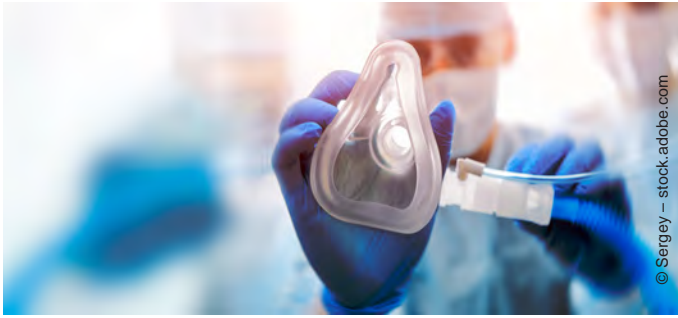
Die Gabe von Sauerstoff ist die wichtigste Behandlung.